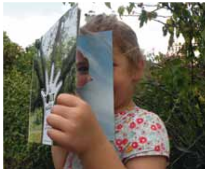
Le tout-Petit d'Anne Letuffe